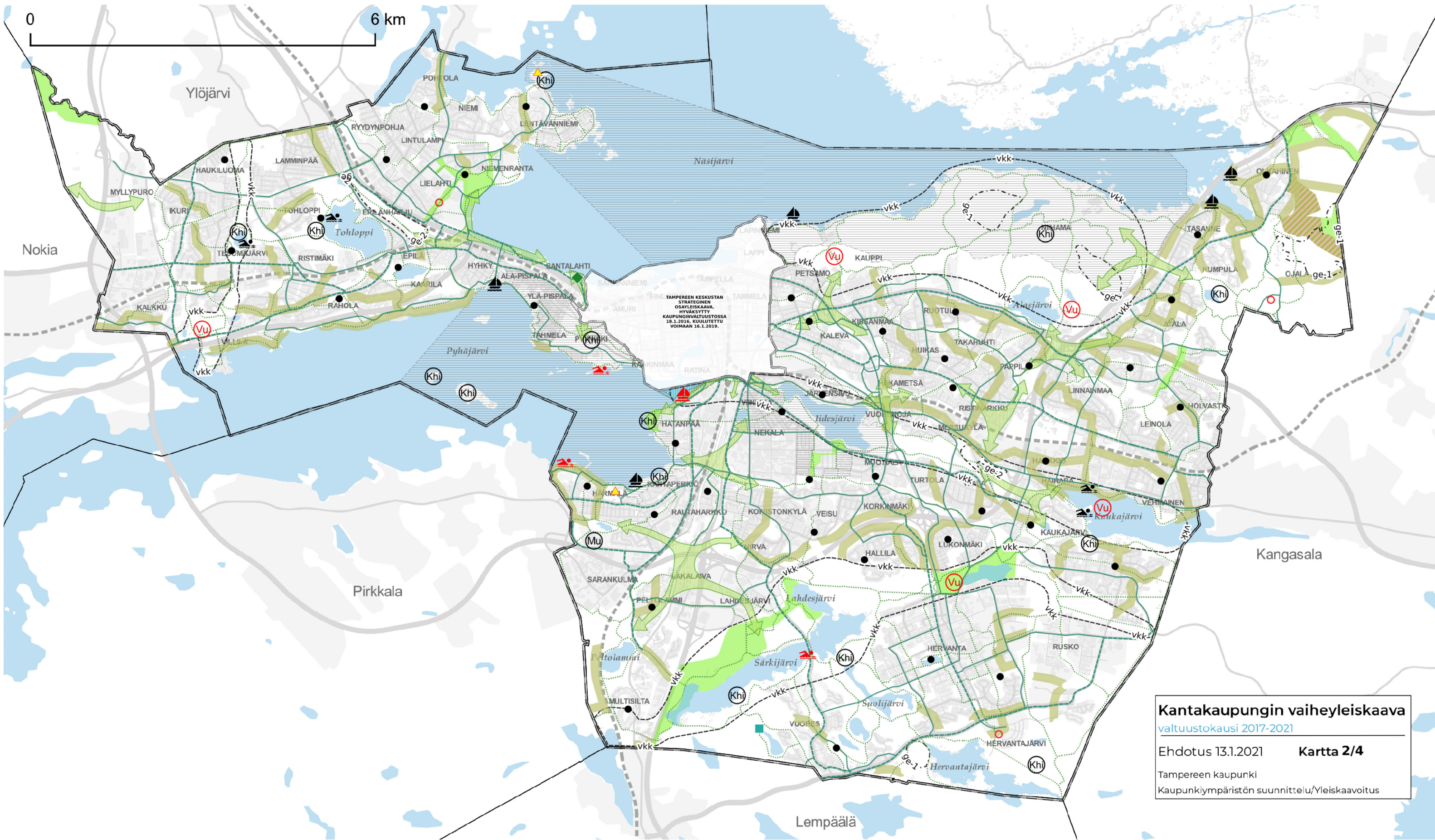
KARTTA 2 - VIHERYMPÄRISTÖ JA VAPAA-AJAN PALVELUT